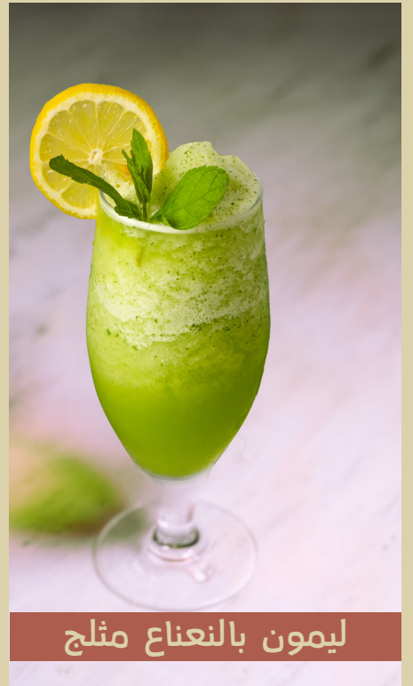
ليمون بالنعناع مثلج