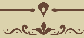
بانا دي ايسابيللا