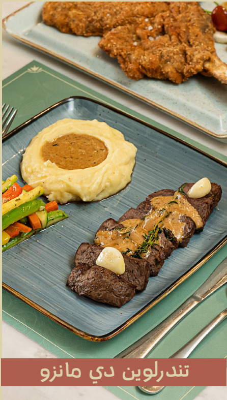
تندرلويين دي مانزو